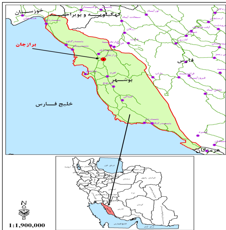
شکل ۱. موقعیت جغرافیایی محدوده مورد مطالعه در تقسیمات کشوری

شهر برازجان مرکز شهرستان دشتستان در طول جغرافیایی ۵۱/۱۳ شرقی و عرض جغرافیایی ۲۹/۱۶ شمالی قرار گرفته و ارتفاع متوسط آن از سطح دریا ۱۳۰ متر می‌باشد. برازجان در فاصله ۶۵ کیلومتری شمال شرقی بوشهر در مسیر جاده بوشهر- شیراز قرار گرفته که از شمال به شهرهای کنار تخته و خشت و از جنوب به اهرم و رودخانه اهرم، از شرق به رشته کوه‌های گیسکان و از غرب به خلیج فارس محدود می‌شود (جودت و همکاران، ۱۳۶۶: ۱۱۴). شهر برازجان با وسعت ۱۴۸۵/۳۵ هکتار در سال ۱۳۹۰ داری ۹۵۴۴۹ نفر جمعیت، ۲۳۹۱۴ خانوار و ۲۲۰۲۹ واحد مسکونی بوده است (سازمان مدیریت و برنامه‌ریزی استان بوشهر، ۱۳۹۰).