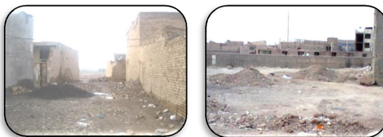
شکل ۲. وضعیت کیفیت مسکن محله از نگاه تصاویر