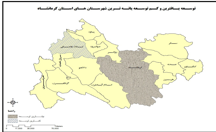
شکل ۲. محروم‌ترین و برخوردارترین شهرستان استان کرمانشاه

شکل (۲)، محروم‌ترین و توسعه‌یافته‌ترین شهرستان از نظر شاخص‌های مورد مطالعه در سطح استان کرمانشاه را نشان می‌دهد. در نقشه مذکور به وضوح مشخص شده که شهرستان ثلاث باباجانی با کمترین سطح توسعه در نیمه غربی استان واقع شده است و در مقابل شهرستان کرمانشاه با بیشترین سطح جمعیت به عنوان توسعه‌یافته‌ترین شهرستان استان در مرکز نقشه جغرافیایی استان قرار دارد و تا حدودی هم متمایل به طرف شرق استان است.