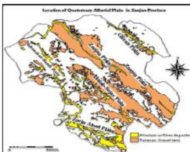
شکل ۱- آبرفت های کواترنری دشت های استان زنجان

براساس بررسی های صورت گرفته در این تحقیق از کل وسعت ۲۲۱۶۴ کیلومتر مربع استان، در ۸۹۴۱ کیلومتر مربع یعنی در حدود ۴۰ درصد سطح استاد شامل آبرفت های کواترنری که بستر اصلی سفره های آب زیرزمینی هستند می باشد (شکل ۲). از طرف دیگر براساس بیانن آبی سال ۸۶-۱۳۸۵، بهره برداری از منابع آب سطحی در حدود ۱۰۱۰ MCM و آب های زیرزمینی ۹۵۰ MCM می باشد. به عبارت دیگر در حدود ۶۰ درصد از آب مورد نیاز استان به طور متوسط از منابع آب زیرزمینی تأمین می شود و با توجه به خشکسالی در چند سال اخیر، بهره برداری از منابع آب زیرزمینی شدت یافته، باعث افت شدید سطح آب زیرزمینی در سفره های آب زیرزمینی موجود در استان شده است (مدیریت منابع آب استان زنجان، ۱۳۸۴، ص ۲۳)