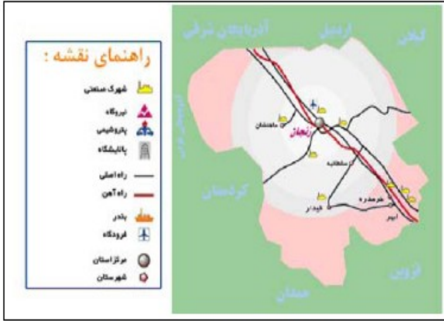
شکل ۴- پراکنش واحدهای صنعتی استان زنجان