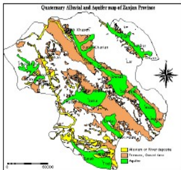
شکل ۲- موقعیت قرار گیری آبخوان‌های موجود در سطح استان نسبت به نقشه پراکنش آبرفت‌های کوتاه‌تری