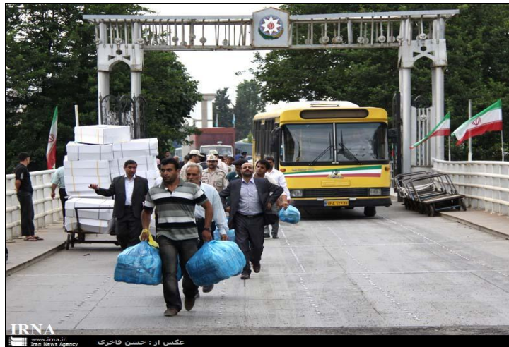
شکل ۲. نمایی از مشارکت روستاییان در تجارت چمدانی در گمرک آستارا