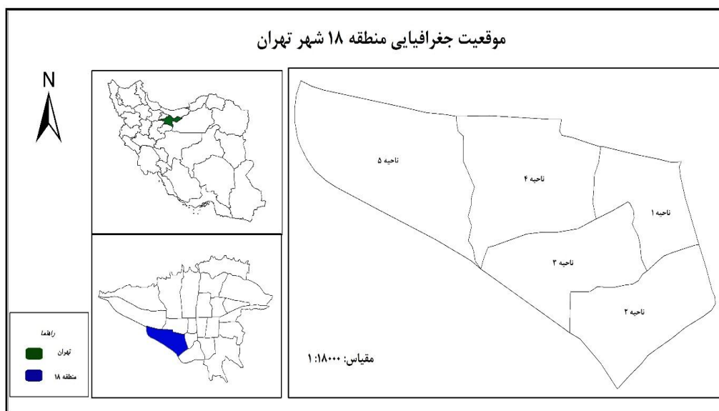
شکل ۱. موقعیت جغرافیایی منطقه ۱۸