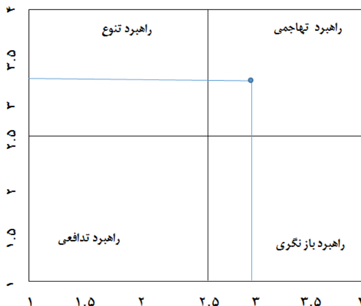
شکل ۳. ماتریس ارزیابی موقعیت و اقدامات استراتژیک

مختصات، بیشترین کشیدگی به هر سمت که باشد، استراتژی در آن سمت می‌باشد. در نتیجه با توجه به اینکه کشیدگی به طرف راهبرد SO است، متمرکز شدن بر روی نقاط قوت و فرصت‌ها جهت توسعه خلاق منطقه، موفقیت‌آمیز خواهد بود. بنابراین می‌توان گفت که بهترین استراتژی و راهبرد برای این پژوهش، راهبرد تهاجمی است.