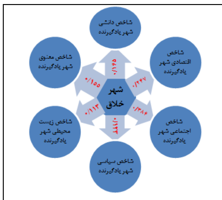
شکل ۳. مدل تجربی تأثیر شاخص‌های شهر یادگیرنده بر شهر خلاق